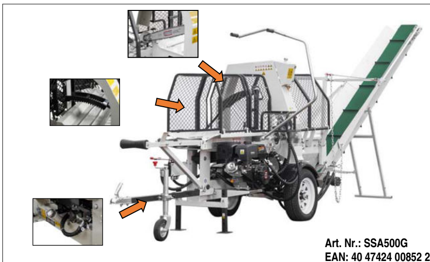
Art. Nr.: SSA500G EAN: 40 47424 00852 2