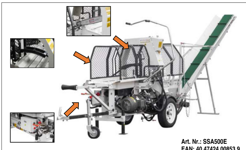
Art. Nr.: SSA500E EAN: 40 47424 00853 9

Bitte beachten Sie, dass das Dreiwege-Steuerventil-Set für die Verwendung der Zubehörteile benötigt wird!