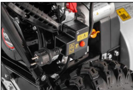
E-Start mittels 230V Stecker