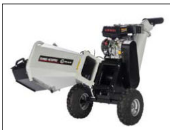
Klappbarer Ein- & Auswurftrichter