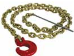
PCA-1295 Choker-Kette 6 mm x 2,1 m mit C-Haken und Stahlstange. Mindestbruchlast: 55 kN