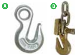
PARALLELHAKEN Grenzlast: 20 kN A. PCA-1280 B. PCA-1282 mit Riegel