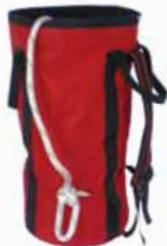
PCA-1256 Mittelgroße Tasche (mit Schulterriemen). - Fasst 100 m des 12 mm Seils.