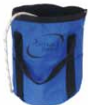
PCA-1255 Kleine Tasche. Fasst 50 m des 12 mm Seils.

Diese Taschen sind ideal, um Ihr Seil und kleineres Zubehör im Forst oder an beliebigen anderen Orten zu tragen oder zu lagern und um Seilverwicklungen zu verhindern.