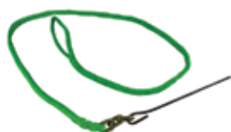
PCA-1372 HPPE Seil-Choker 9,5 mm x 2,1 m mit Stahlstange. Mindestbruchlast: 69 kN

Sie haben auch unter diesen großartigen Zubehörteilen die Wahl je nach Ihrer Anwendung.