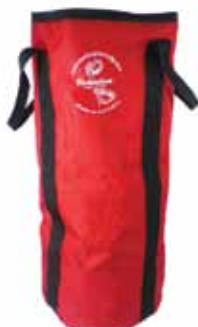
PCA-1257 Große Tasche. Fasst 150 m des 12 mm Seils.