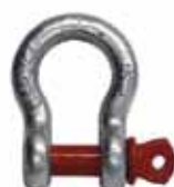
Schäkel PCA-1279 - 13 mm – Grenzlast: 19,6 kN PCA-1277 - 16 mm – Grenzlast: 31,9 kN PCA-1278 - 20 mm – Grenzlast: 46,6 kN