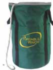
PCA-1257XL Extragroße Tasche. Fasst 200 m des 12 mm Seils.