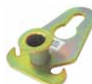
PCA-1310 Zugaufsatzplatte für Seil oder Kette für Anhängervorrichtung mit Kugelköpfen bis zu 50 mm Durchmesser.