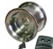
Spilltrommeln mit Seilführungen PCA-1100 – 85 mm für PCW5000 PCA-1110 – 57 mm für PCW5000 PCA-1120 – 76 mm für PCW3000