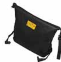
PCA-0103 Plastikseiltasche für Tragegestell (PCA-0104). Fasst 50 m des 10 mm Seils.