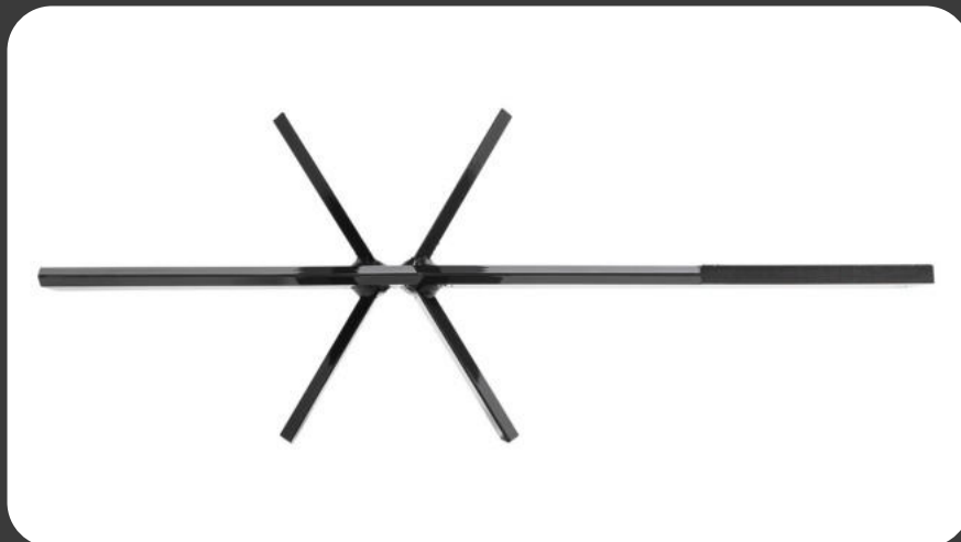
5SSA500SK - Spaltkreuz 6fach