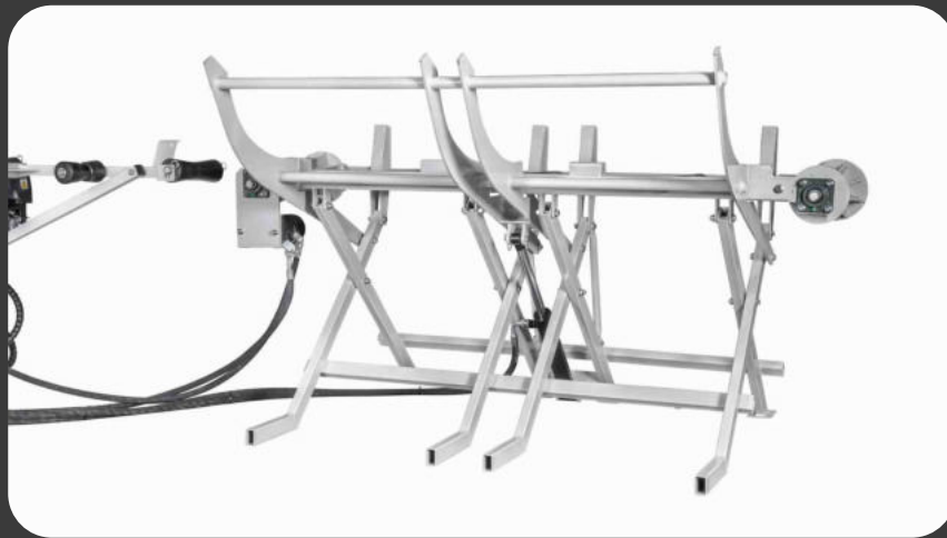
5SSA400SH - Stammheber