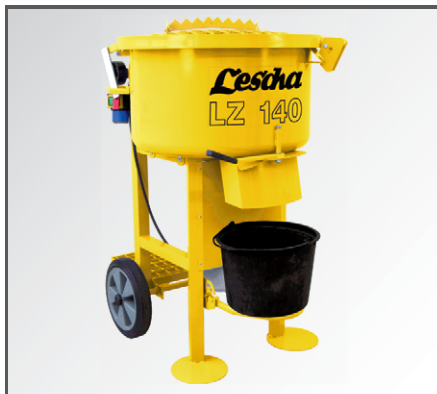
Die klappbare Eimerkonsole ermöglicht ein direktes Entleeren des Mischgutes z.B. in einen Mörtelimer oder in eine Schubkarre.