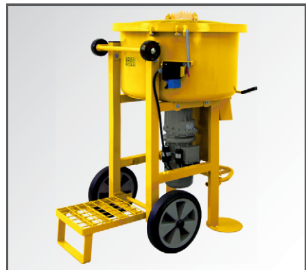
Die hintere Klappstufe und der Sackaufreißer gewährleisten ein bequemes Befüllen der großen 140 Liter Trommel.