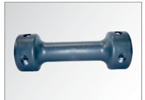
Inklusive Transportrolle für einen einfachen Transport.