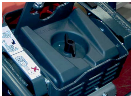
3-faches Luftfilter System für eine hohe Zuverlässigkeit.