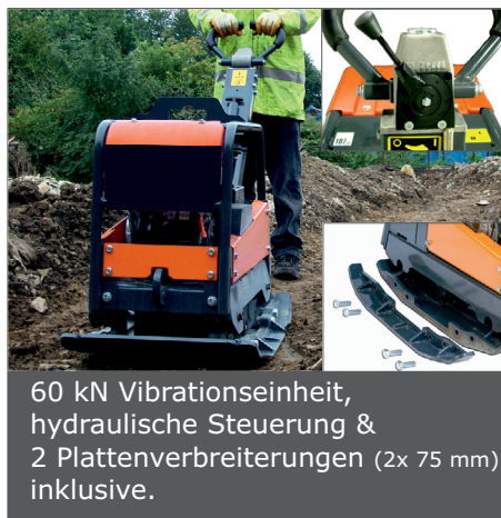
60 kN Vibrationseinheit, hydraulische Steuerung & 2 Plattenverbreiterungen (2x 75 mm) inklusive.