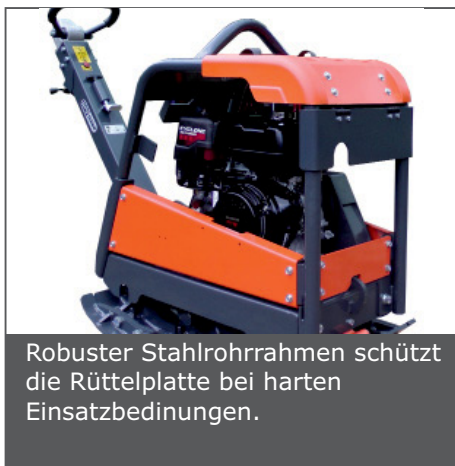
Robuster Stahlrohrrahmen schützt die Rüttelplatte bei harten Einsatzbedingungen.