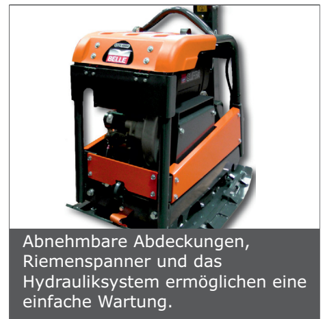
Abnehmbare Abdeckungen, Riemenspanner und das Hydrauliksystem ermöglichen eine einfache Wartung.