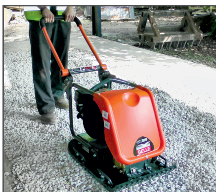
Ausgelegt auf maximale Verdichtung, ideal für den Einsatz im Baugewerbe sowie für die Vermietung. Sehr lange Nutzungszeiten dank niedriger Hand-Arm-Vibration.