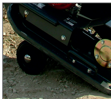
Ein klappbares Fahrwerk für den einfachen Transport ist ebenfalls als Zubehör erhältlich: Art.Nr. BEOPP/50/DIO