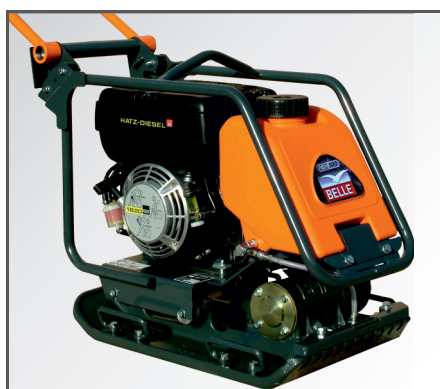
*Optional mit Wasser-Set (Wassertank & Wassersprühanlage).