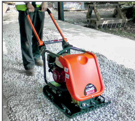
Ausgelegt auf maximale Verdichtung, ideal für den Einsatz im Baugewerbe sowie für die Vermietung. Sehr lange Nutzungszeiten dank niedriger Hand-Arm-Vibration.