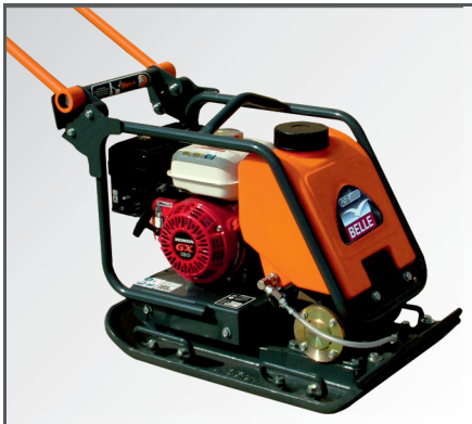
*Optional mit Wasser-Set (Wassertank & Wassersprühanlage).