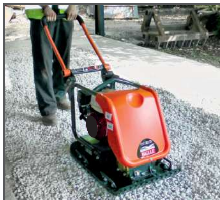
Ausgelegt auf maximale Verdichtung, ideal für den Einsatz im Baugewerbe sowie für die Vermietung. Sehr lange Nutzungszeiten dank niedriger Hand-Arm-Vibration.