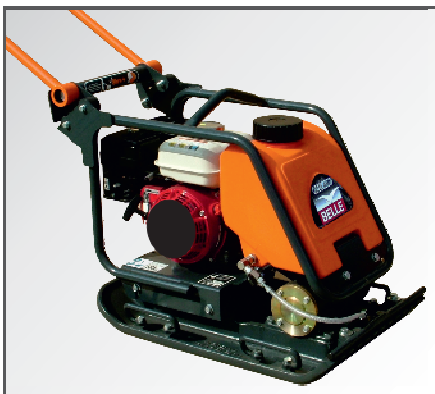
*Optional mit Wasser-Set (Wassertank & Wassersprühanlage).