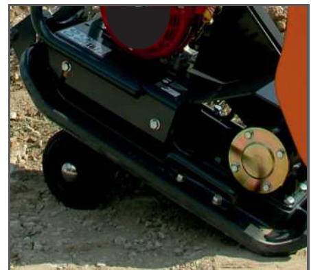
Ein klappbares Fahrwerk für den einfachen Transport ist ebenfalls als Zubehör erhältlich: Art.Nr. BEOPP/50/DIO