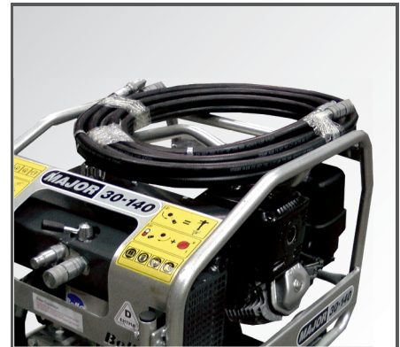
Inklusive 7 Meter langem Zwillingschlauch.