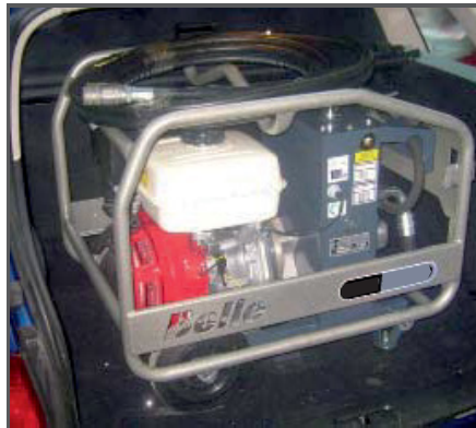
Das kompakte Design ermöglicht den Transport in einem Kombi Kofferraum.