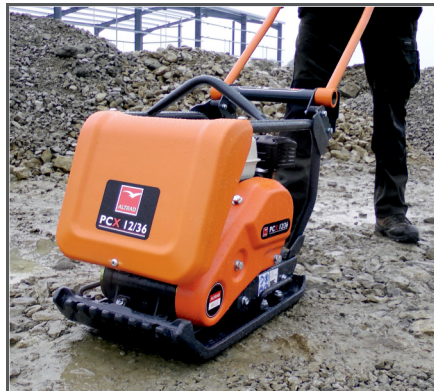
Hochfrequenz-Vibrationseinheit mit 12 kN bei 101 Hz, wartungsfreien Rüttellagern und einer verstärkten Fliehkraftkupplung für eine lange Lebensdauer.