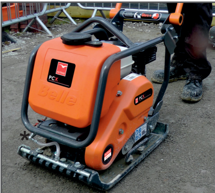
*Optional mit Wasser-Set (Wassertank & Wassersprühanlage) oder als Zubehör erhältlich: Art.-Nr. BEOPP/70S/DIO