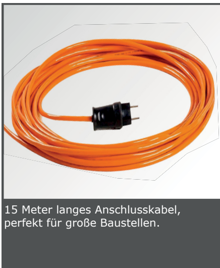
15 Meter langes Anschlusskabel, perfekt für große Baustellen.