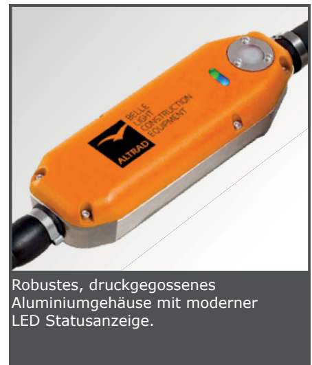
Robustes, druckgegossenes Aluminiumgehäuse mit moderner LED Statusanzeige.