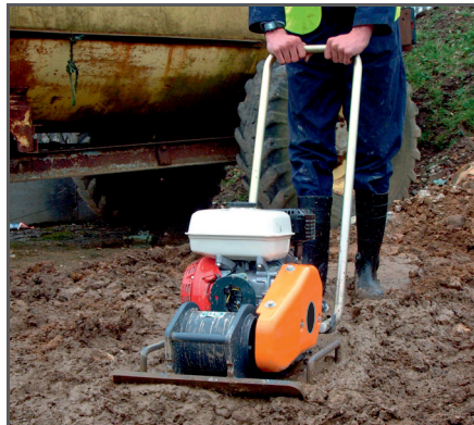
Robuste „Special Force“ Rüttelplatte. Starke Vibrationseinheit (18 kN bei 90 Hz) und extra dicke Grundplatte für raue Einsatzbedingungen.