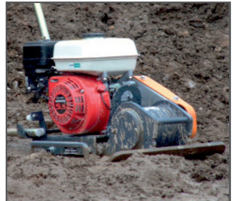
Hohe Fahrgeschwindigkeit und eine effektive Verdichtung auch bei schwierigen Bodenverhältnissen.