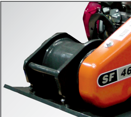
Geringer Wartungsaufwand dank einer ölgelagerten Vibrationseinheit.