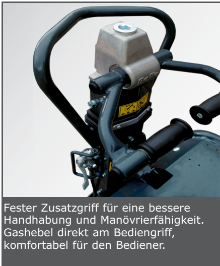
Fester Zusatzgriff für eine bessere Handhabung und Manövrierfähigkeit. Gashebel direkt am Bediengriff, komfortabel für den Bediener.