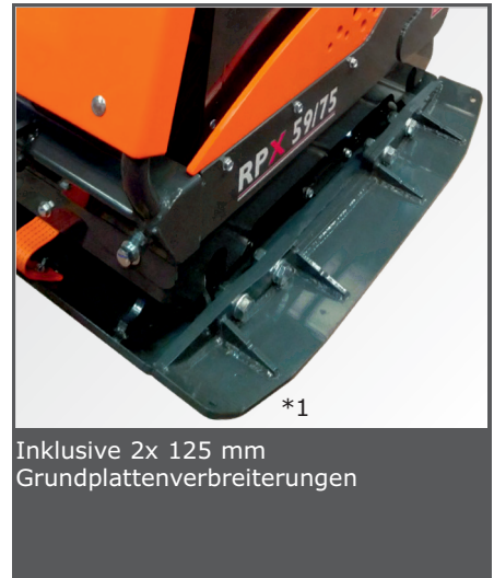
Inklusive 2x 125 mm Grundplattenverbreiterungen