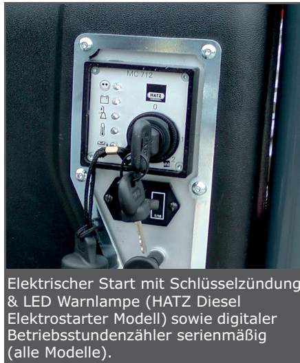
Elektrischer Start mit Schlüsselzündung & LED Warnlampe (HATZ Diesel Elektrostarter Modell) sowie digitaler Betriebsstundenzähler serienmäßig (alle Modelle).