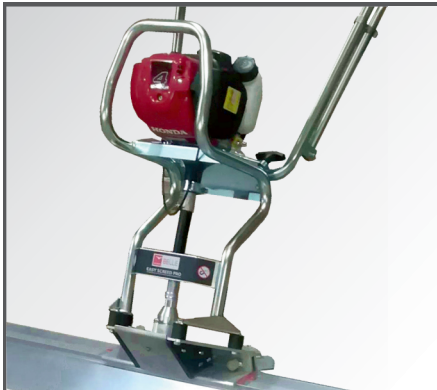
Antriebseinheit mit leistungsstarkem HONDA 4-Takt Benzinmotor und gerader, flexibler Antriebswelle.