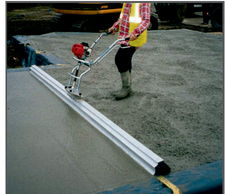
Einfache Handhabung und Bedienung. Mit höhenverstellbaren Bedienarmen sowie Schnellspanner für ein schnelles und einfaches Wechseln des Aluminiumbalken (Patsche).