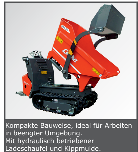
Kompakte Bauweise, ideal für Arbeiten in beengter Umgebung. Mit hydraulisch betriebener Ladeschaufel und Kippmulde.