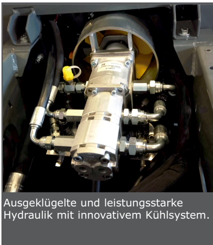
Ausgeklügelte und leistungsstarke Hydraulik mit innovativem Kühlsystem.