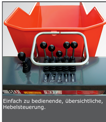
Einfach zu bedienende, übersichtliche, Hebelsteuerung.