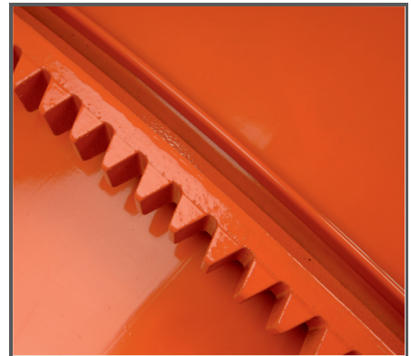
Hohe Lebenserwartung dank Pulverbeschichtung sowie abriebfestem Grauguss beim Zahnkranz und Antriebsritzel.