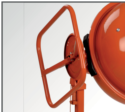
Ergonomisches & leichtgängiges Handrad mit Scheibenbremse & Fußbedienung für das stufenlose Verstellen der Mischtrommel.