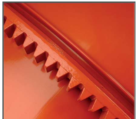
Hohe Lebenserwartung dank Pulverbeschichtung sowie abriebfestem Grauguss beim Zahnkranz und Antriebsritzel.