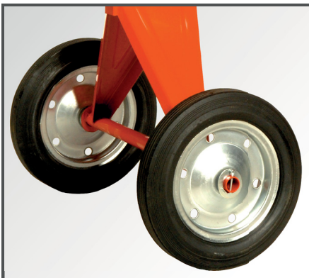
Große Räder (Ø 400 mm), mit Metallfelgen und pannensicherer Vollgummibereifung, für einen einfachen Transport.